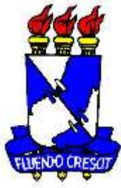
Universidad Federal de Sergipe Brasil